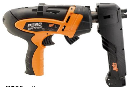
P560 mit Magazinadapter